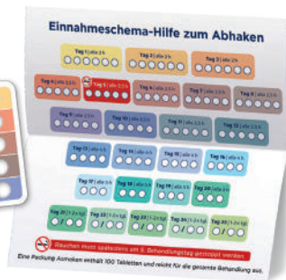
Einnahme-Hilfe zum Abhaken